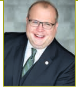
Bürgermeister Stephan Paule