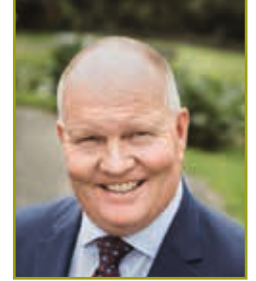
Karsten Schmal Präsident des Hessischen Bauernverbandes